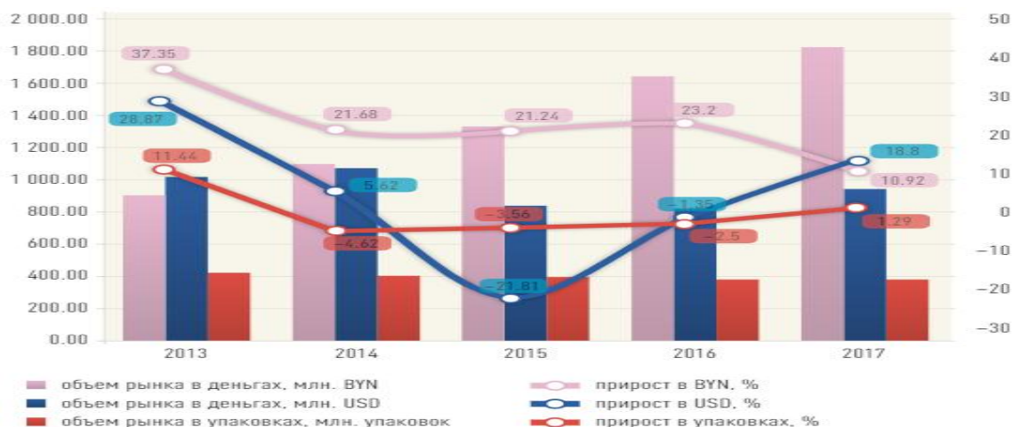
Рис. 3. Объём фармацевтического рынка Республики Беларусь за 2014-2017 гг.