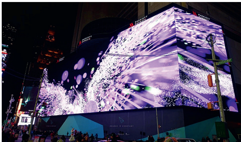
Рис. 4. Медиафасад Ultra-HD четкости на Таймс-Сквер. Нью-Йорк