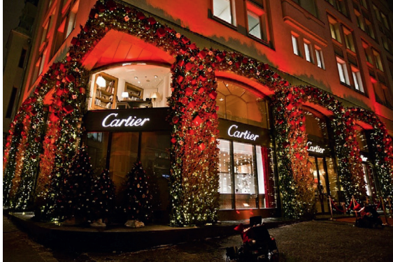
Рис. 1. Вечерняя подсветка магазина ювелирных украшений и часов Cartier в г. Москве. В световом решении заложена вертикальная градация элементов подсветки: сплошная заливка светом фасада, светильники-маркеры, скользящая подсветка, точечные светильники для подсветки мелкой пластики

С. М. МИХАЙЛОВ, Н. Р. НАСЫБУЛЛИНА S. M. MIKHAILOV, N. R. NASYBULINA