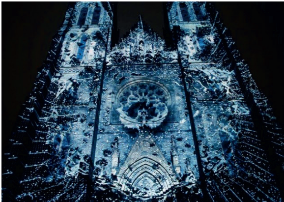
Рис. 2. Видео-проекция на Храм Св. Людмилы в Праге на Фестивале света Signal. На основе новейших цифровых технологий свето-художникам удается перенести зрителей в параллельную реальность, где оживают самые непредсказуемые образы и персонажи