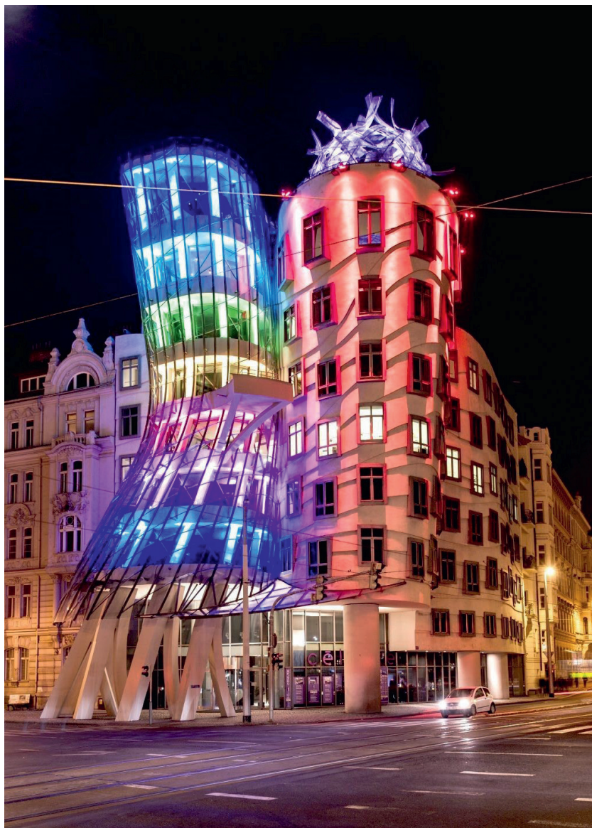
Рис. 3. Видео-проекция на «Танцующий дом» в Праге на Фестивале света Signal