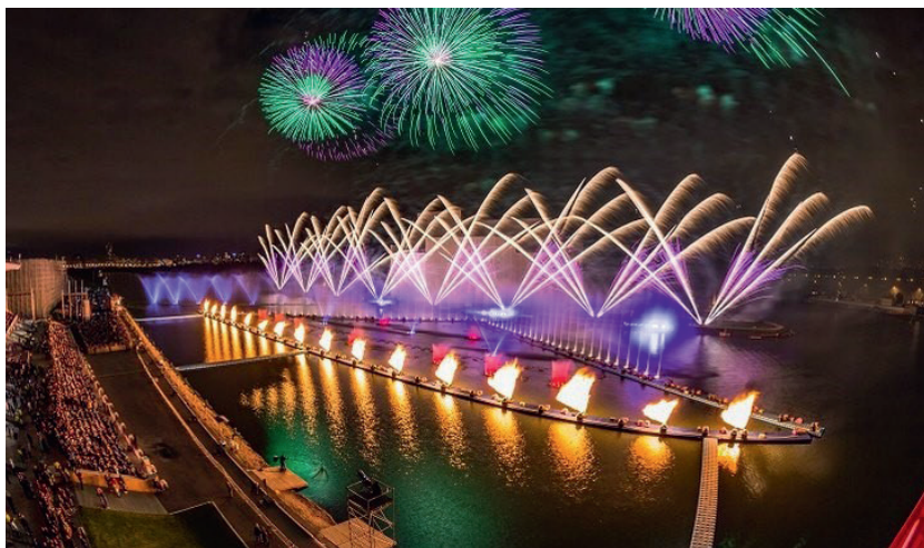
Рис. 6. Шоу фонтанов в Останкино (Москва) на фестивале «Круг Света»