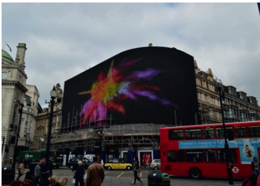
Рис. 7. Масштабный медиафасад на известной площади Пикадилли-сёркус в Лондоне