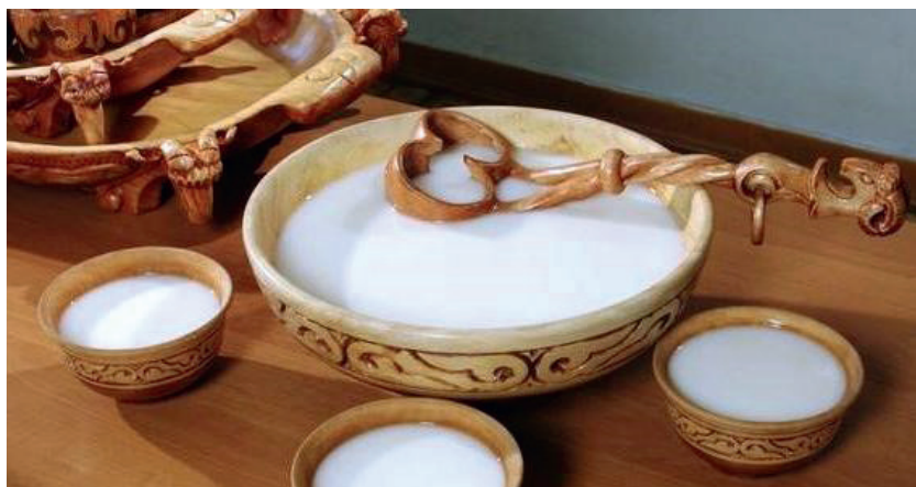
Рис. 1. Астау, шара, ожау