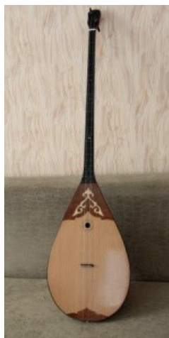
Рис. 2. Домбыра