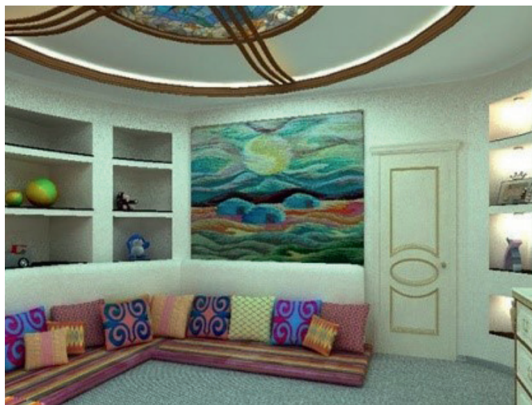
Рис. 7. Примеры интерпретации элементов Юрты в современном жилом интерьере