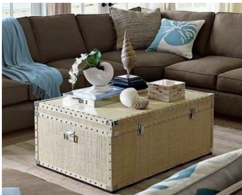
Рис. 6. Примеры композиционной организации сандык в современном интерьере