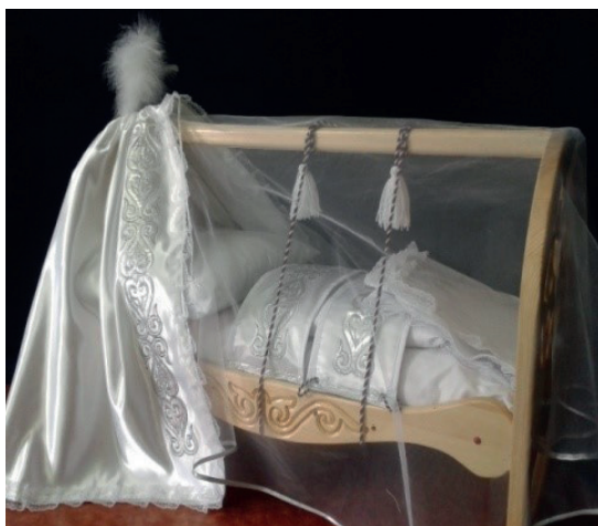
Рис. 4. «Бесик» - первая колыбель малыша