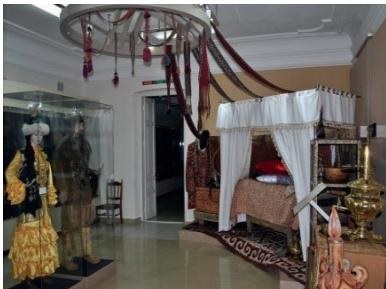
Рис. 5. Примеры композиционной организации «Шымылдык» в современном интерьере