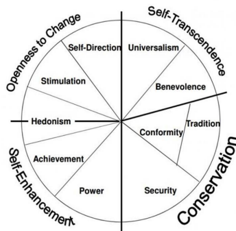
Fig. 1. – Schwartz’s Theory of Basic Human Values (Schwartz, 2003)

In order to visualize these relationships better, the theory constructs ten values into circular structures. There are two bipolar dimensions: one “contrasts ‘openness to change’ and the other-‘conservation’ values (Fig.1).