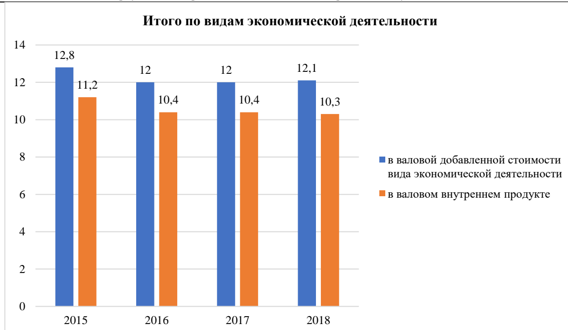
Рисунок 1.3 – Динамика теневой экономики в Республике Беларусь (в процентах) за 2015-2018 гг.

Примечание – Источник: составлен по [5;6].