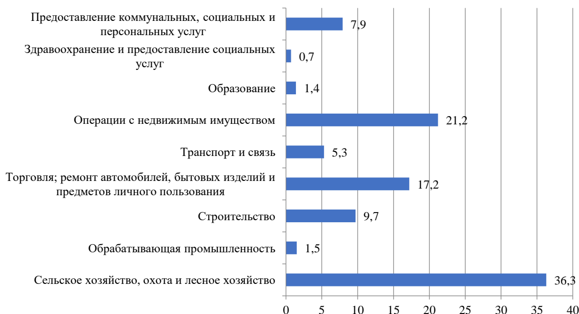
Рисунок 1.4 – Удельный вес ненаблюдаемой экономики в валовой добавленной стоимости в текущих ценах по видам экономической деятельности по оценке за 2011 год (в процентах)

Ненаблюдаемая экономика проникает в те сферы деятельности, где по естественным причинам трудно контролировать операционную или финансовую деятельность. Рассмотрим изменения теневой экономики в сфере производства и услуг, перейдем к анализу удельного веса ННЭ по видам экономической деятельности (рисунок 1.4 и 1.5).