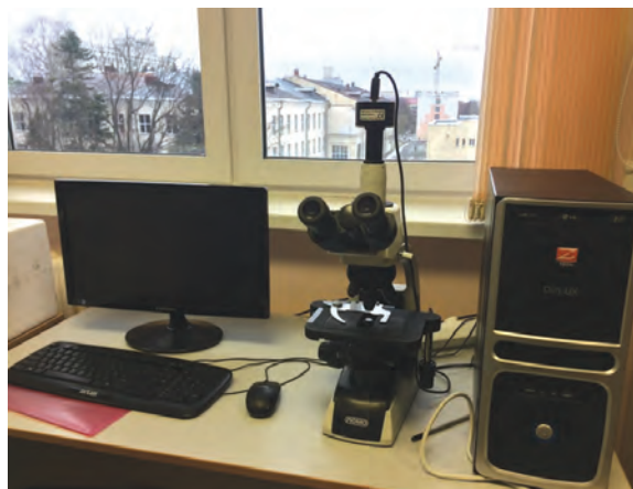
Рисунок 1 – Микроскоп ЛОМО с камерой digital Camera for Microscope DCM310 (USB2/0) 3M pixels, CMOS для оценки размеров пор пивоваренного ячменя

Для эксперимента были отобраны пять проб ячменя сорта “Батка” по 100 г каждая. Пивоваренный ячмень подвергался предварительной обработке переменным неоднородным электрическим полем в трехкратной повторности. Образцы зерна №1 обработаны неоднородным электрическим полем напряженностью 1 МВ/м; №2 – 1,2 МВ/м; №3 – 1,3 МВ/м; №4 – 1,4 МВ/м; №5 – не обработанное зерно, контроль – не обработанное зерно.