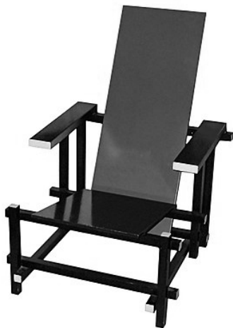
Рис. 3. Красно-синий стул: Геррит Ритвельд (1918 г.)

При применении этих принципов на практике выяснялось, что конструкции представляли собой пластический образ и поэтому как бы парили над землей. «Де стиль» в основном выражался в интерьере и архитектуре, однако был опредмечен Герритом Ритвельдом в качестве красно-синего стула.