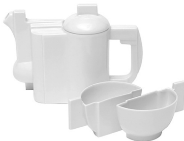
Рис. 2. Сервиз, спроектированный Казимиром Малевичем (1934 г.)

Попробуем сформулировать понятие стиля относительно дизайна. Стиль в дизайне – единство всех элементов формы изделия, которые в последующем формируют художественный образ какого-либо произведения дизайна [1]. В настоящий период времени дизайн является важным фактором формирования предметной среды и образа жизни человека. Дизайн и стиль являются понятиями, которые тесно связаны друг с другом. Различные трактовки, которые на разных этапах присваивались понятию «стиль», являлись отражением различных подходов к этому феномену. Например, представители авангардистского стиля пытались выразить свою идеологию стремления к экспериментам и отхода от типичного художественного языка в предметной форме. Сервиз, производившийся по эскизам Казимира Малевича, одного из лидеров авангарда – пример воплощения идей стилевого направления в предметах. Традиционная форма чашек в данном сервизе изменена полусферами с прямоугольными ручками, а вместо привычных для 30-х годов росписей на керамике – белый цвет. По словам самого Малевича его задачей не было создания удобного сервиза: «Это не чайник, но идея чайника» [2].