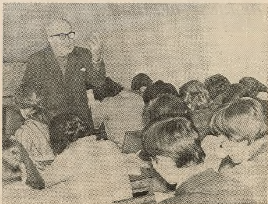
Васіль Іванавіч Сцяпанану — загадчык кафедры марксісцка-ленінскай філасофіі прыродазнаўчых факультэтаў, член-карэспандэнт АН БССР, прафесар. За актыўную дзейнасць ва ўніверсітэцкім таварыстве «Веды» ўзнагароджан медалём Вавілава. НА ЗДЫМКУ: В. І. СЦЯПАНАУ чытае лекцыю «Матэрыя і асноўныя формы яе існавання» на другім курсе хіміфака.