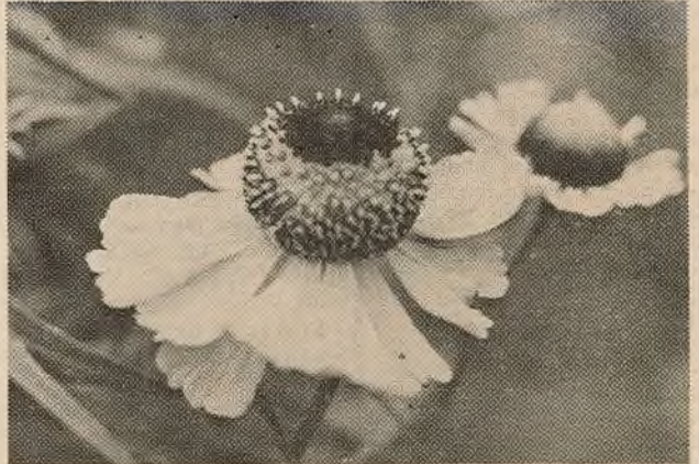
Апошняя ўсмішка лета.