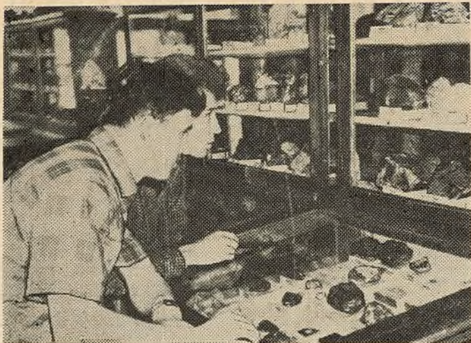
У мінералагічным музеі ўніверсітэта.