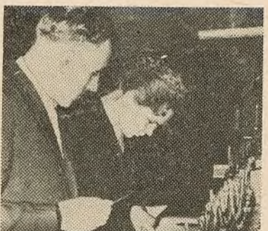
У аналітычнай лабараторыі хі- міка ідуць заняткі.

Вялікае і шматбаковае прымя- ненне хіміі ў народнай гаспадар-