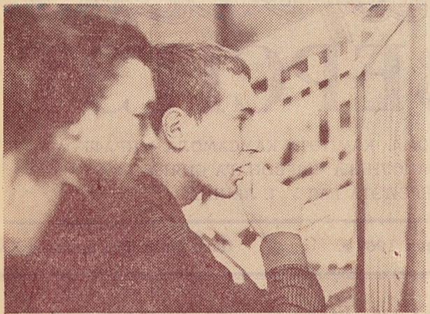
НЯЎЖО ЗНОЎ НЯЎДАЧА?..