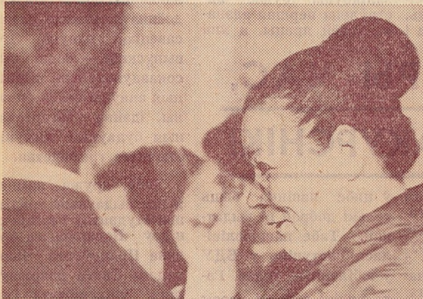
МАЛАДЗЕЦ, СЫНОК! ПАСТУШУ...