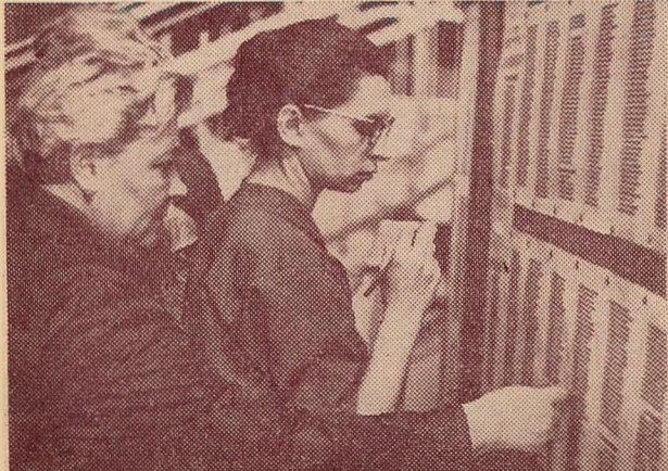
АЛЕ КАЛІ НЯМА, ДЫК НЕ ЗНОЙДЗЕШ...