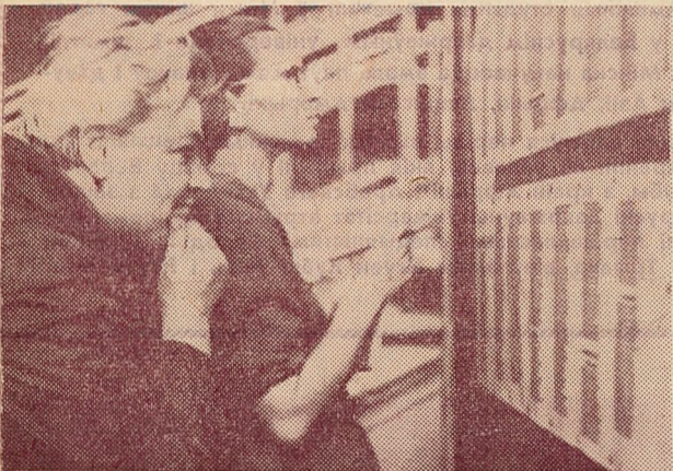
ЦЯЖКА АДШУКАЦЬ АДНО ПРОЗВІШЧА СЯРОД СОЦЕНЬ...