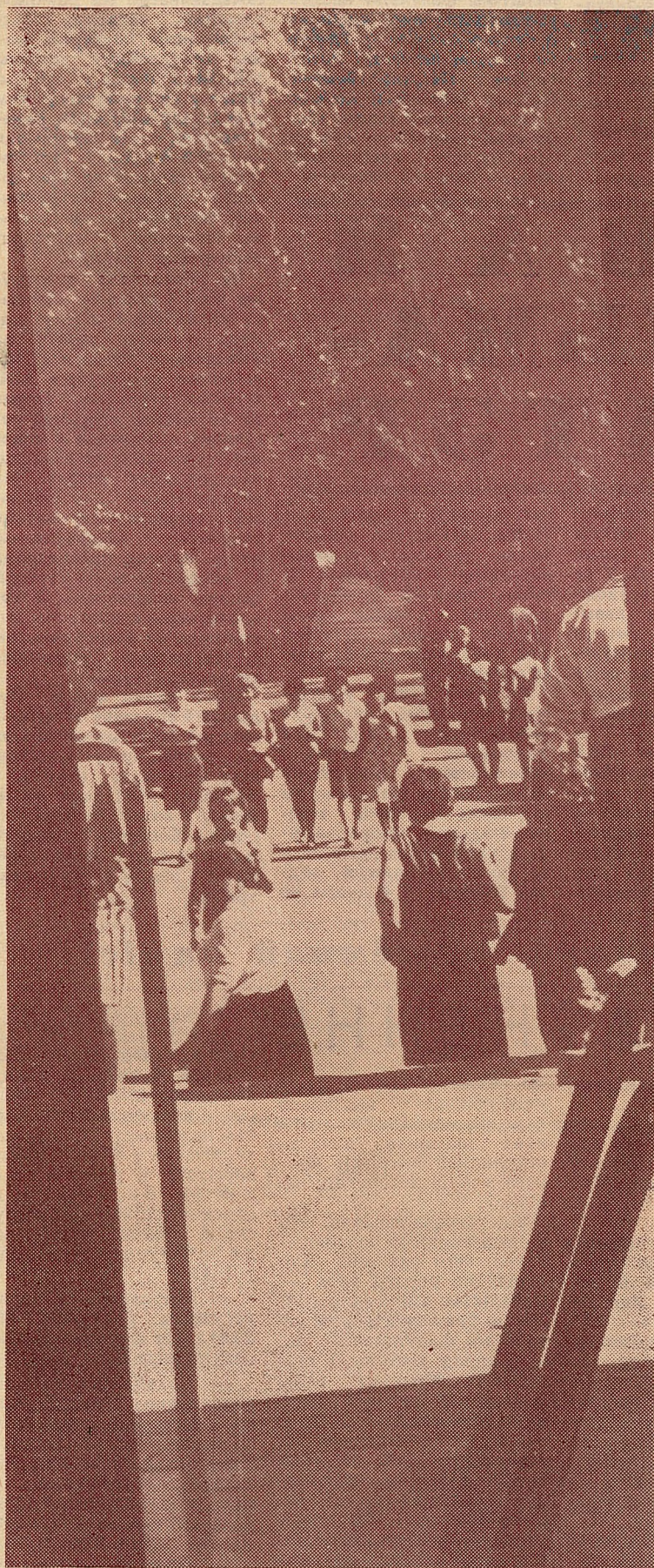
1 ВЕРАСНЯ. СЕННЯ ГАСЦІННА АДЧЫНІЛІСЯ ДЗВЕРЫ БЕЛАРУСКАГА ДЗЯРЖАўНАГА УНІВЕРСІТЭТА. ПАЧАўСЯ НАВУЧАЛЬНЫ ГОД...