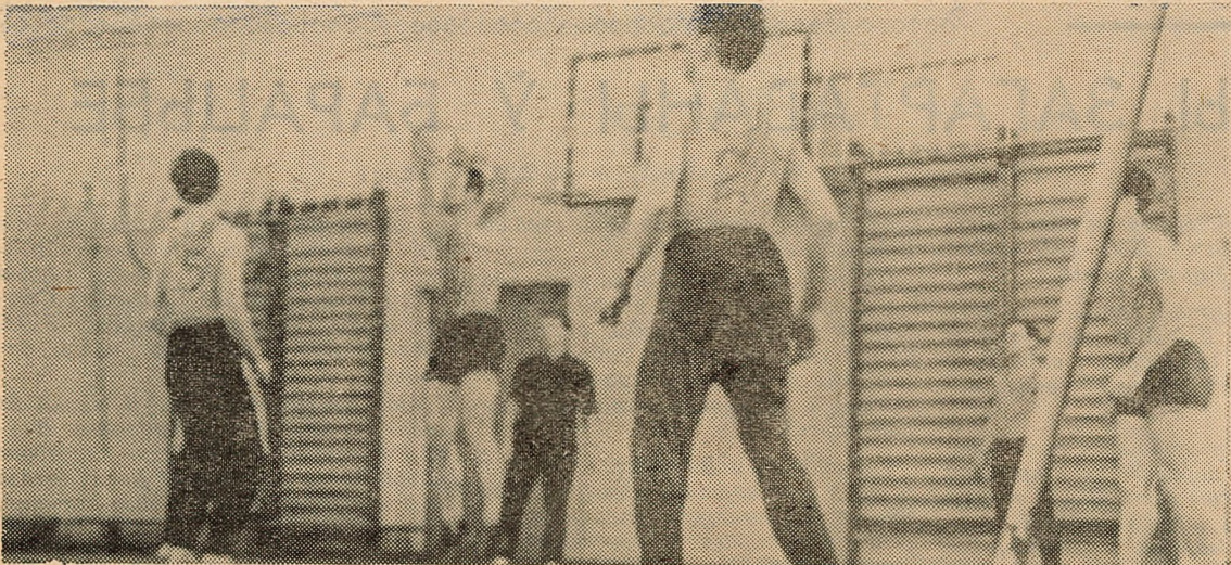
Спартсмены філфана на трэніроўцы.