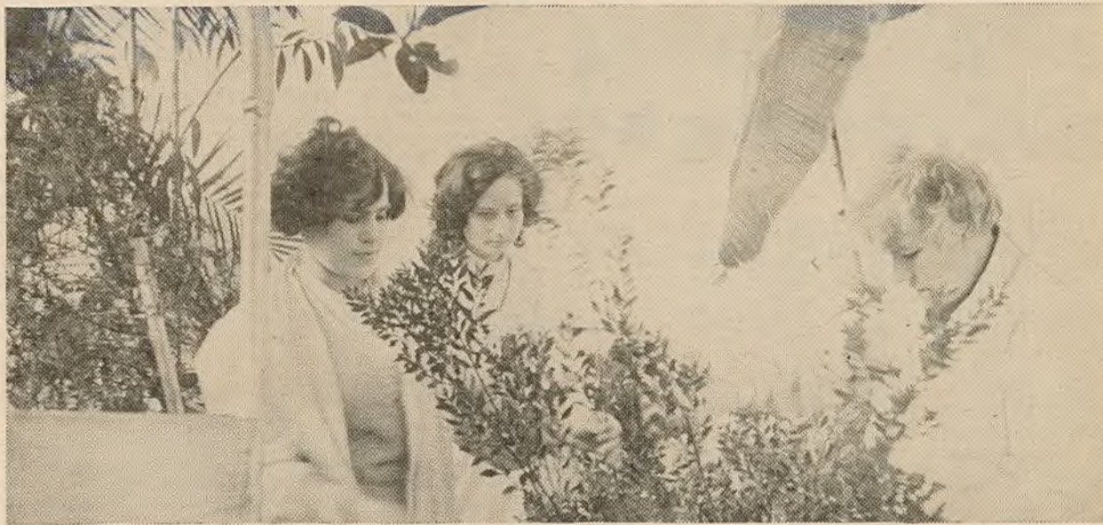
Ва ўніверсітэцкай аранжорэі рыхтуюцца да вясны.