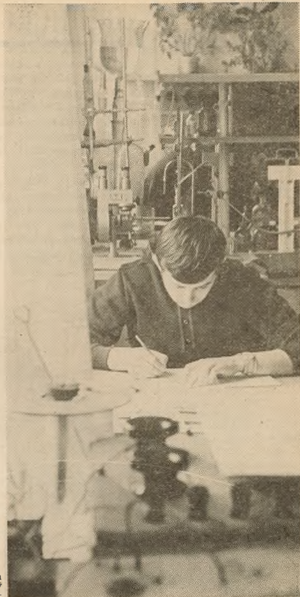
Кожная хвіліна працоўнага дня — напружанай вучобе. Лабараторныя заняткі па фізічнай хіміі ў студэнтаў ІІІ курса хімічнага факультэта.