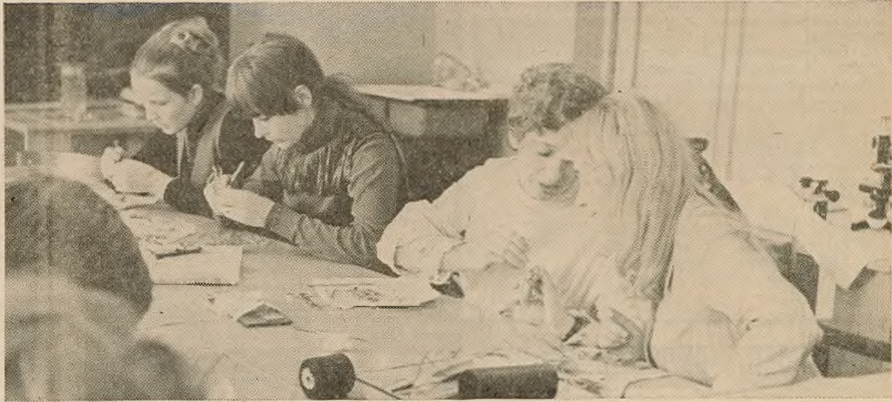
Вялікі практыкум па заалогіі ў студэнтаў IV курса біяфака.

Цікава прывесці вынікі конкурсу студэнцкіх работ. Так, на рэспубліканскім агляд-конкурсе 1971 года біялагічны факультэт прадставіў 56 работ. Да I катэгорыі былі аднесены 39 з іх і 17 работам прысуджана II катэгорыя. Адхіленых работ і работ III катэгорыі не было. У 1972 годзе на рэспубліканскім агляд-конкурсе прадставіў 78 работ. З іх да I катэгорыі аднесены 57 а астатнія 21 аднесены да II катэгорыі. Акрамя таго, пяць работ аднесены да катэгорыі лепшых па секцыі