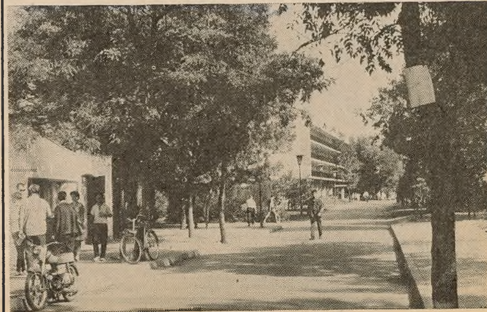
У горадзе Бургасе.