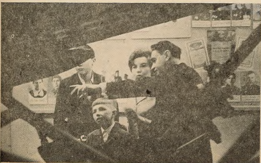
● У музеі гісторыі Вялікай Айчыннай вайны ля легендарных «кацюш».

Клопат аб эмацыянальным уздзеянні на слухачоў — зусім апраўданы. Чаму, напрыклад, глыбокі след у душах студэнтаў пакідае наведанне музея гісторыі Вялікай Айчыннай вайны, нават у тых, хто там бываў раней? На мой погляд, адказ на пытанне заключаецца ў тым, што да расказаў, тлумачыняў прыцягваюцца тут