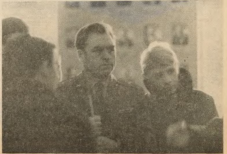
● Студэнты БДУ ў падзізфнай воінскай часці.