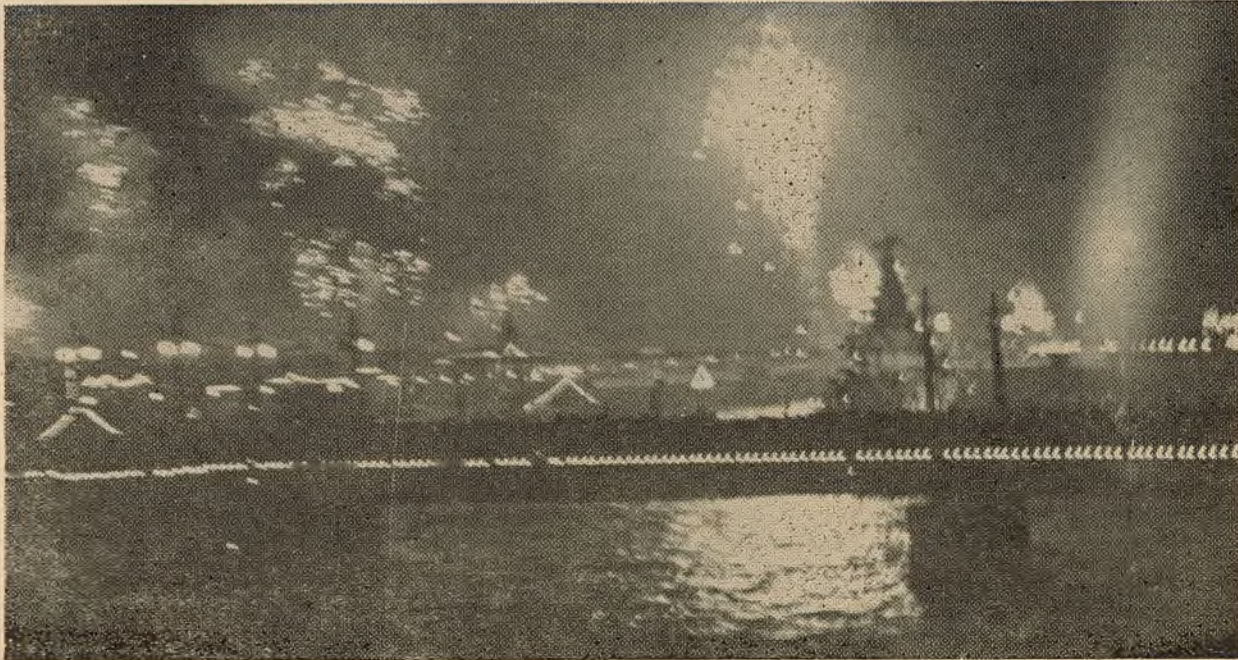
СВЯТОЧНЫ ГОРАД ЛЕНІНА.