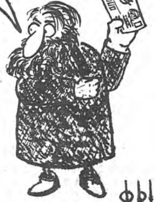
Рисунок Фёдора ПЕКАРСКОГО ФЫ.