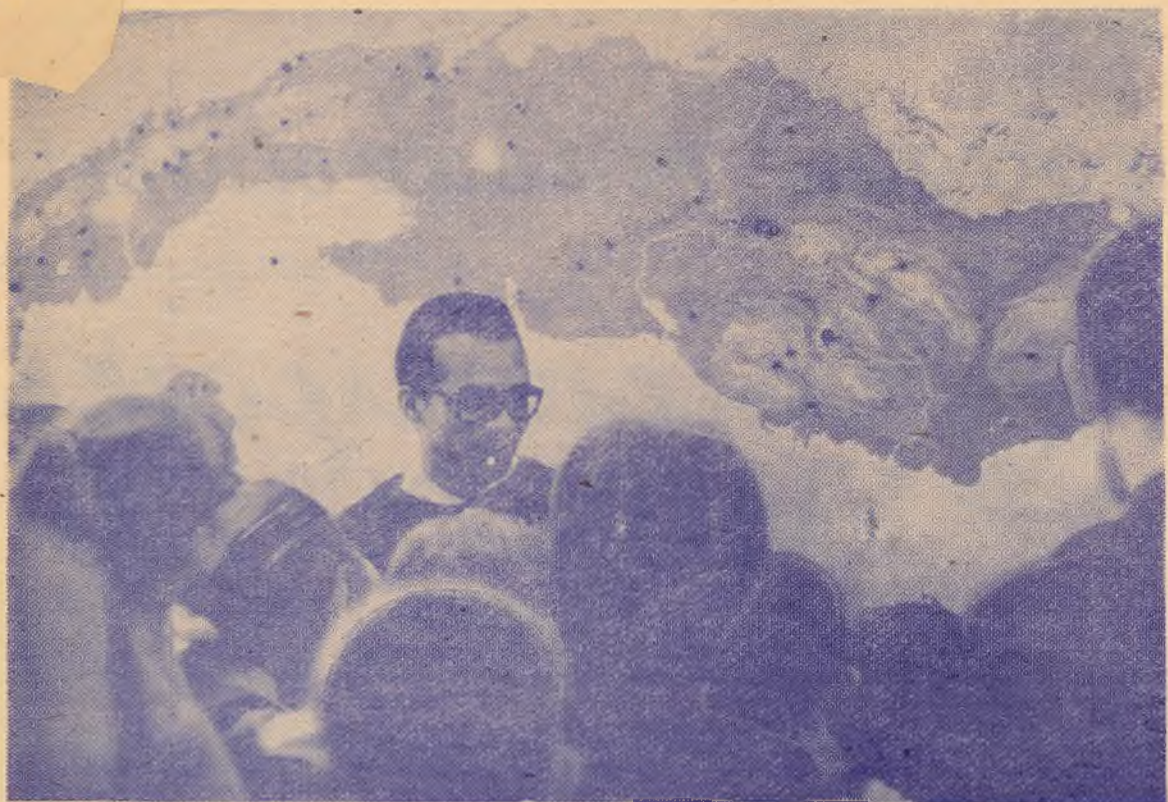
Для гераічнага вострава Свабоды святкаванне Новага года супадае са святкаваннем гадавіны рэвалюцыі. Кубінскія студэнты, што навучаюцца ў беларускіх вышэйшых навучальных установах, таксама рыхтуюцца дастойна сустрэць нацыянальнае свята.