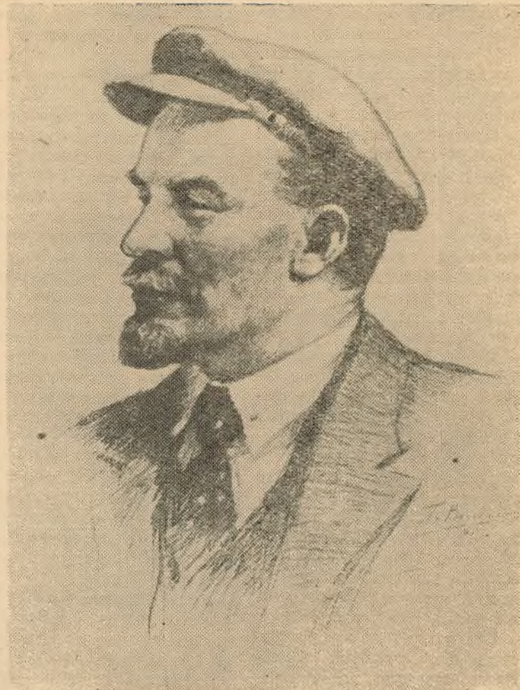
У. І. ЛЕНИН

Пропахший почкою заволглой, Дул ветер яростный с полей, Пересыпал апрель за Волгой, Как жемчуг, цепи журавлей. В тот час Владимирской дорогой На смерть колодники брели, Взяв от родимого порога Комок оттаявшей земли. Они брели... И стаей птичьей Плыли за ними облака. Ломая лед, полна величья, Вздыхала русская река. И, набухая гневом синим, Стихая клокотала вся... В тот вешний день в моей России Великий Ленин родился.