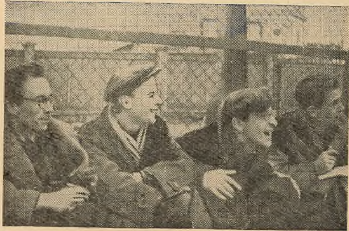
Балельшчыкаў на гэтых спаборніцтвах было нямнога, але «хварэлі» яны горача, як і ўсе балельшчыкі на свеце.

Настойліва змагаліся за першае месца мужчынскія каманды. Толькі ў дадатковай сустрэчы лідэраў—каманд хімфака і фізфака-1—выявіўся пераможца. Фізікі выйгралі важную сустрэчу і сталі чэмпіёнамі на 1959 год. На другім месцы валејбалісты хімфака, на трэцім—гістфака.