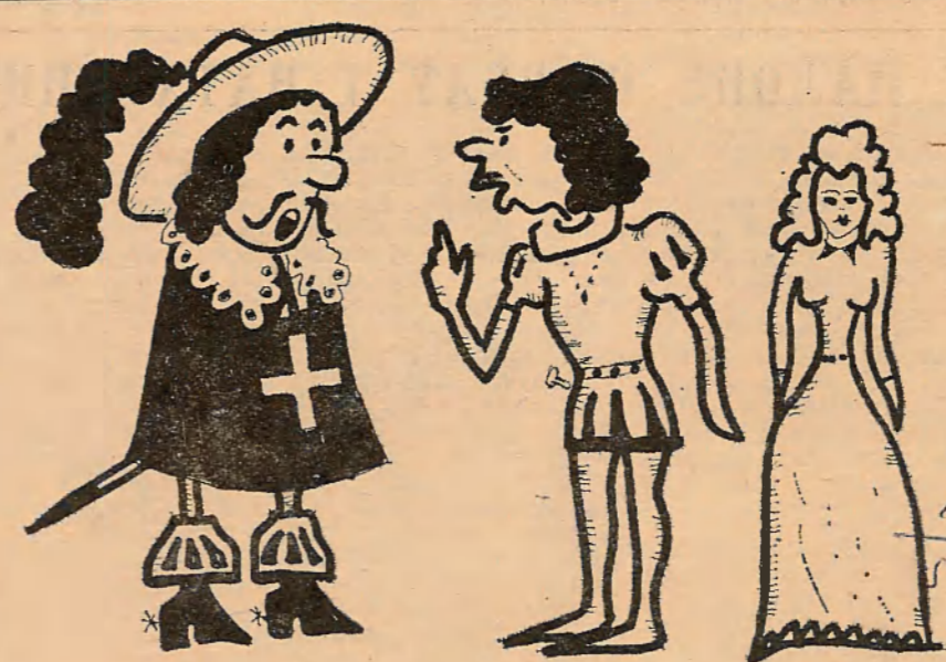
На навагоднім bale-маскарадзе: «Будзён прыставаць да Джульеты, перастаць паказваць на экзаменах». Навагоднія мары студэнтаў. Малюнк А. Дубравіна.