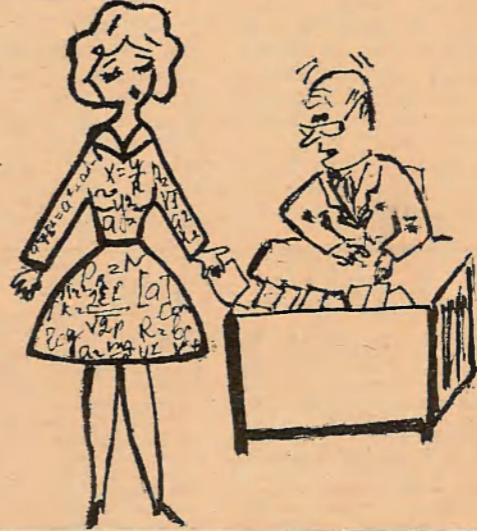
— Вашае сукенка нешта мне нагадвае. Малюнк А. Дубравіна.