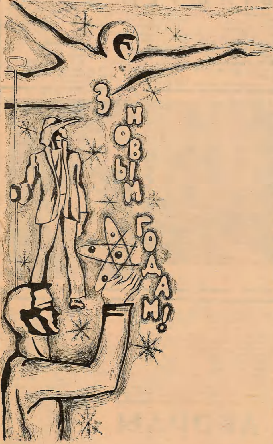
Малюнак Н. Лугавой.

№ 38 (2012) ● Чацвер, 25 снежня 1975 г. ● Цана 2 кап. ● Газета выходзіць з 1935 г.