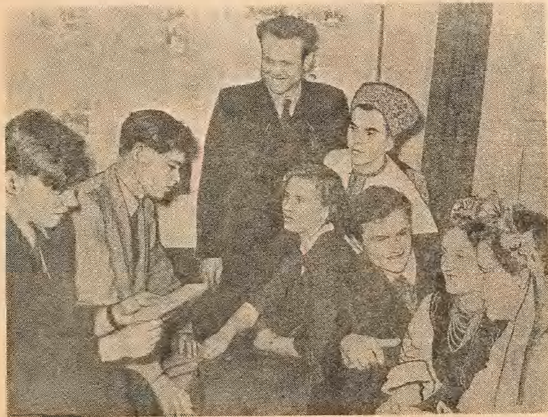
Пасля канцэрта. Удзельнікі ўніверсітэцкай самадзейнасці гутараць з моладымі рабочымі.