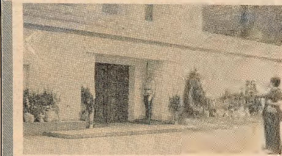
Маўзалеі Георгія Дзімітрава.

ку па Балгарыі, наведала географічны факультэт Сафійскага ўніверсітэта. Сонечная Балгарыя! Колькі добрага аб гэтай краіне гавораць наведваюшыя яе! І мы, зрабіўшы першы крок па балгарскай зямлі, пераканаліся ў справядлівасці гэтых водгукаў.