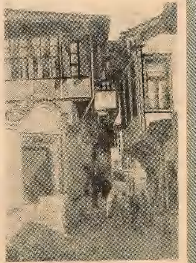
Адна з вуліц старога Пловдзіва.

А. Неускага. Ён пабудаван у знак удзячнасці рускім воінам, якія загінулі