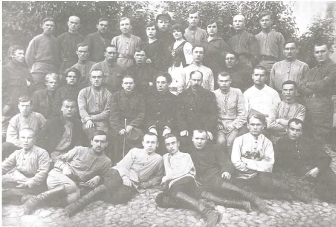
Якуб Колас і Змітрок Бядуля сярод студэнтаў рабфака БДУ. 1922 г.

БДУ — Беларускі дзяржаўны ўніверсітэт! Рабочы факультэт! Кожнае слова як удар гучнага