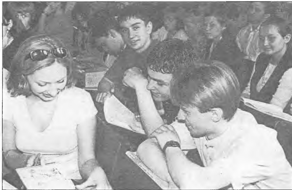
На факультэце журналістыкі

Інтэрнат мае чытальныя залы, відэасалон, спартыўны пакой (абсталяванне «Kettler»), тэнісны спартыўны пакой, нумары павышанай камфортнасці, клуб «Кактус», кавярню, філіял псіхалагічнай службы і інш.