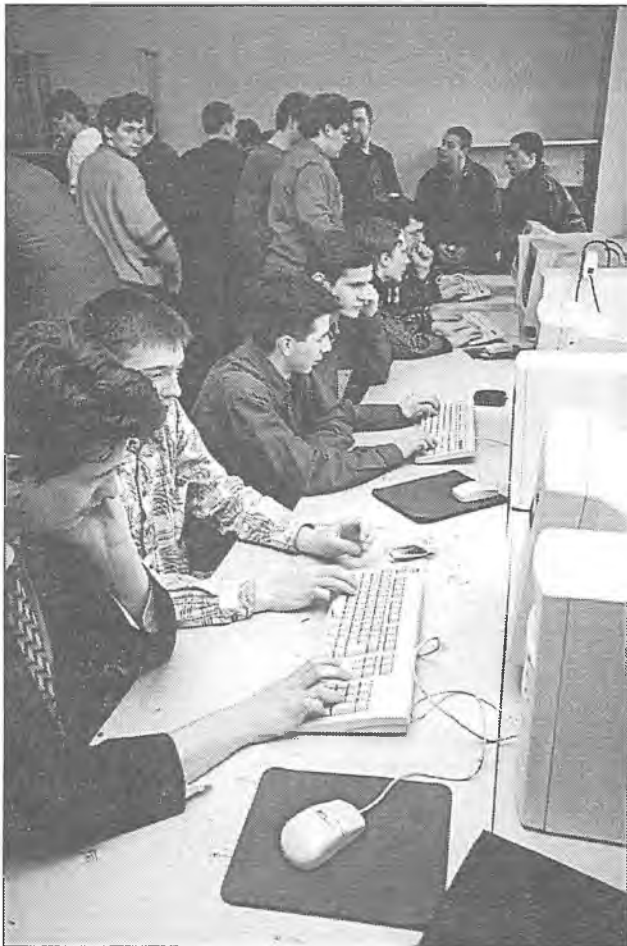
На факультэце прыкладнай матэматыкі і інфарматыкі