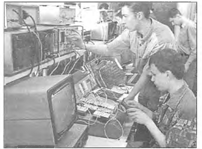
На фізічным факультэце

На пачатку 2001 г. здадзены ў эксплуатацыю новы корпус біялагічнага факультэта. Адметны ён наяўнасцю хола з зямлінамі і вальерай з жывымі птушкамі. У корпусе таксама створаны віварый з эксперыментальнымі жывёламі.