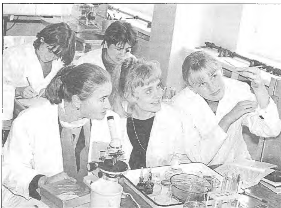
На біялагічным факультэце

Галоўнае — гэта змест курсаў грамадазнаўчага цыкла. І тут, на мой погляд, першачарговымі з’яўляюцца наступныя патрабаванні: строгае навуковасць, аб’ектыўнасць, гістарычная праўда, адданасць патрыятычным традыцыям і маральным каштоўнасцям беларускага народа. Вышэйшая школа прызвана выходзіць грамадзяніна-патрыёта, здольнага ствараць у імя Айчыны.