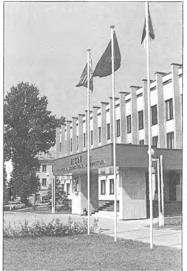
Корпус Ліцэя БДУ

Прэзідэнт Беларусі Аляксандр Рыгоравіч Лукашэнка ўдзельнічаў у святочным адкрыцці новага будынка ліцэя БДУ. Тады Прэзідэнт адзначыў: “Таленавітая моладзь — гэта фонд нацыі, гонар народа і прэстыж краіны. Таму адкрыццё новага будынка ліцэя — падзея важная для ўсёй нашай рэспублікі”.