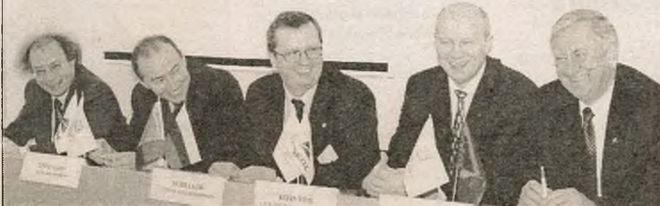
Падчас прэс-канферэнцыі ў РІВШ БДУ

8 снежня на базе Беларускага дзяржаўнага ўніверсітэта адкрыўся першы ў Беларусі Рэспубліканскі цэнтр Інтэрнэт-адукацыі.