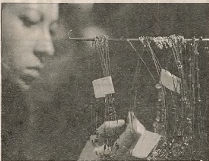
На выставе-кірмашы «Каменная казка»