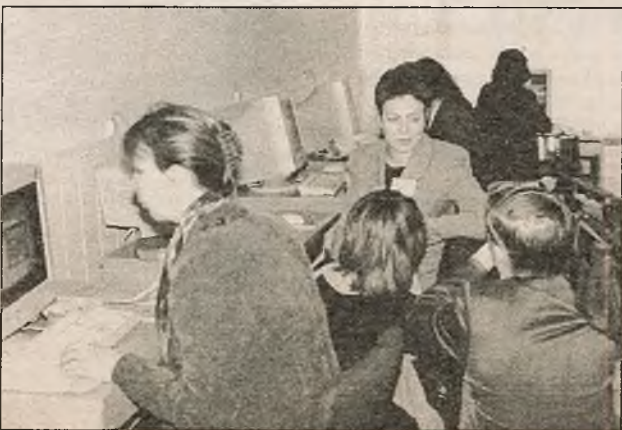
Заняткі ў Інтэрнэт-цэнтры ўжо распачаліся