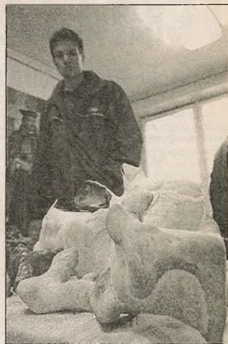
На выставе-кірмашы «Каменная сказка»