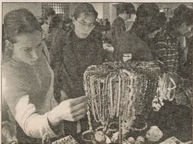
На выставе-кірмашы «Каменная сказка»