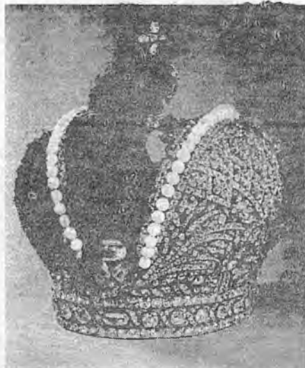
"Вялікая імператарская карона". Брыльянты, шпінель, жэмчуг. Работа І. Пазье. 1762 г.

Захапляльна чароўнае здзіўленне, няспынае жаданне пазнаваць дорыць чалавеку спрадвечная гармонія свету камяню, якія патаемнымі нітамі злучаюць навуку, культуру і адукацыю. Пэўна, таму праз стагоддзі і тысячагоддзі пранесла чалавецтва любоў да гэтага цудоўнага ўтварэння. Сакрэт яго чароўнасці яшчэ і ў дасканаласці, непаўторнасці, прыгажосці. Нават калі вымаўляеш словы "каштоўны камень", гэта гучыць прыгожа, а дадаць "жэмчуг" — адразу перад вачыма ўзнікае вобраз пляшчотна-бялюткі з вясёлкава-пералівістай маціцай (перламутрам). Менавіта таму само слова "жамчужны" азначае высокую якасць і з'яўляецца сімвалам чысціні. Пэўна, вы здагадаліся, што сёння пойдзе размова пра гэты камень вышэйшага класа таму, што ён лічыцца шчаслівым каменем чэрвеня і асабліва пасуе людзям, якія нарадзіліся ў гэтым месяцы. Вядома, я запрашаю да вітрыны "Каштоўныя камяні", дзе побач з рубінамі, сафірамі, апаламі і інш. маціца дзве натуральныя жамчужыні, знойдзеныя ў Міжземным моры і прывезеныя з Італіі. Такім чынам, расповед пра жэмчуг.