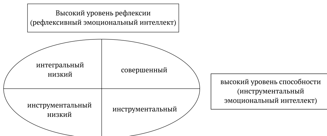
Рис. 1. Рефлексивные и нерефлексивные виды эмоционального интеллекта субъекта деятельности

Динамика эмоционального интеллекта в онтогенезе включает в себя «не только повышение его показателей, но и рост внутренней согласованности» [22, с. 19]. Результаты исследований дают основание утверждать, что у испытуемых с наиболее развитым («совершенным») эмоциональным интеллектом высокому уровню инструментального эмоционального интеллекта должны соответствовать высокие показатели индивидуально-личностного эмоционального интеллекта. Интегральный низкий эмоциональный интеллект может свидетельствовать о том, что индивид адекватно отражает в сознании низкий объективный уровень эмоционального интеллекта, однако не стремится к его дальнейшему развитию (или проявлению имеющихся в наличии эмоциональных способностей), поскольку оно либо