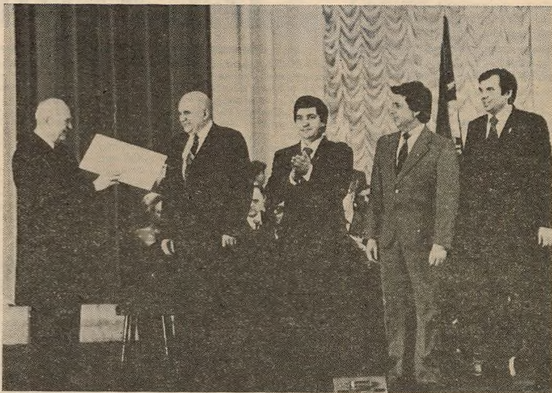
Уручэнне Ганаровай граматы Вярхоўнага Савета Беларускай ССР.