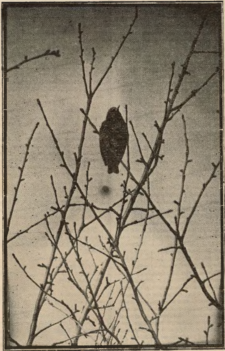
«Добры дзень, сонца!»