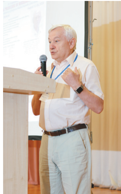
Адкрыццё школы-канферэнцыі. Віцэ-дырэктар Аб'яднанага інстытута ядзерных даследаванняў (АІЯД) у Дубне Рыхард Ледніцкі (Чэхія)