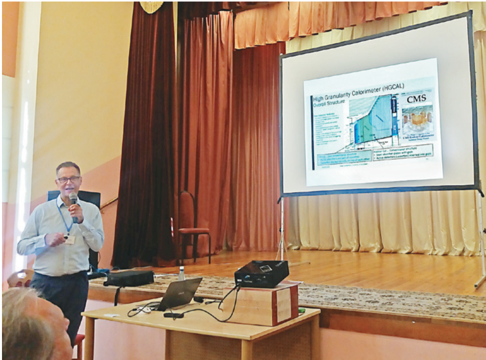
Лекцыя пра структуру дэтэктара эксперыменту CMS на Вялікім адронным калаідары. Прафесар Павел Дэ Барбаро (Універсітэт Рочэстэра, ЗША)