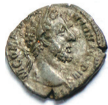
Сярэбраная манета рымскага імператара Камода

ваецца каля 15 000, практычна беспакarana рабуюцца і пашкоджваюцца тысячы яшчэ не адкрытых навукоўцамі археалагічных помнікаў. Часта не маючы ўяўлення пра археалогію, а часам наўмысна і нягледзячы на тое, што іх дзейнасць пераследуецца па законе, марадзёры ў пошуках нажывы ці задавальняючы бяздзейную цікавасць да пошуку старажытнасцяў, дзесяцігоддзямі знішчаюць невядомыя старонкі гісторыі беларускага народа. Таму археолагам вельмі важная дапамога добраахвотнікаў, якія аказваюць садзейнічанне ў ахове помнікаў гісторыі і культуры Беларусі, а таксама бяруць удзел у нашых даследаваннях.