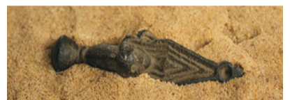
Наканечнік ножан мяча I пал. V ст.