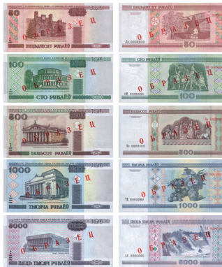
рис. 6. Белорусские рубли образца 2000 года, крупные номиналы с видами Минска и Брестской крепости.