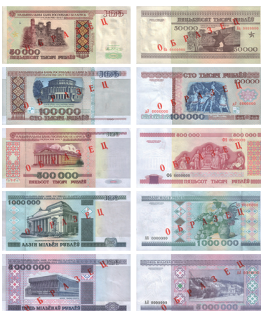
рис. 4. Белорусские рубли с видами Минска и Брестской крепости, декабрь 1994 — сентябрь 1999 годов.