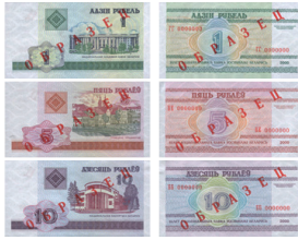
рис. 5. Белорусские рубли образца 2000 года, мелкие номиналы с видами Минска.