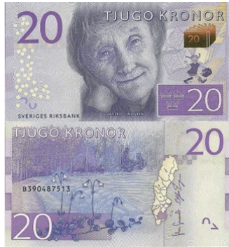
рис. 11. Шведские кроны нового образца.