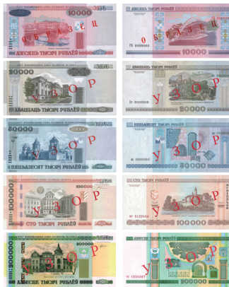
рис. 7. Белорусские рубли образца 2000 года, крупные номиналы с видами других городов Беларуси.