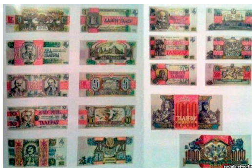
рис. 8. Проект белорусских талеров, 1992 год, автор концепции Вл. Круковский, художник банкнот Л. Бартов.