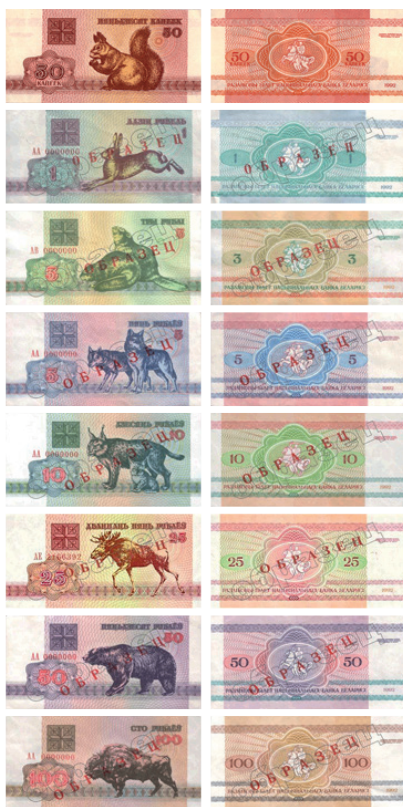
рис. 1. Белорусские рубли («зайчики»/«белочки»), май 1992 года, автор концепции С. Слабченко, художник К. Хотяновский.