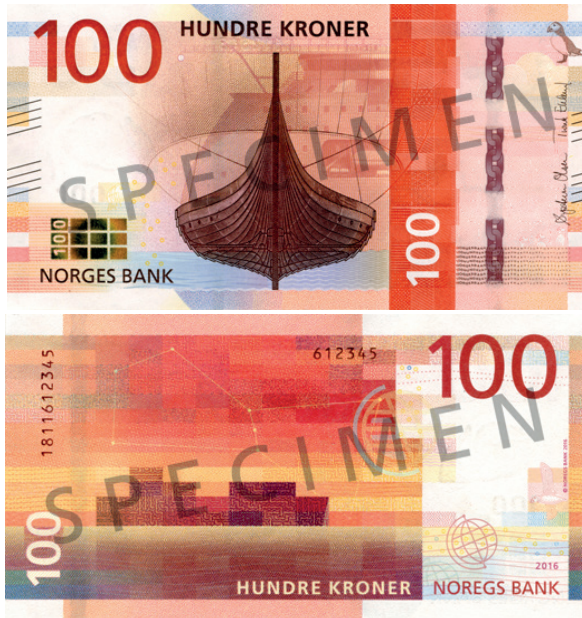
рис. 12. Норвежские кроны нового образца.