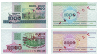
рис. 3. Белорусские рубли с видами Минска, Выпуск 1998 года с заменой герба «Погоня» на изображение номинала в картуше.