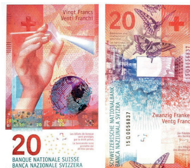
рис. 14. Швейцарские франки к проекту «Многогранная Швейцария».