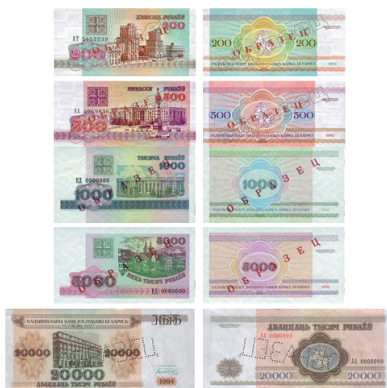
рис. 2. Белорусские рубли с видами Минска, декабрь 1992 — апрель 1994 годов.