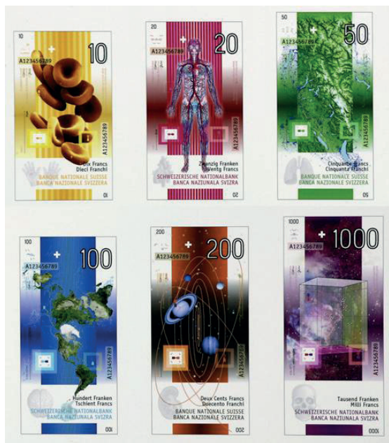
рис. 13. Швейцарские франки к проекту «Швейцария открыта миру».