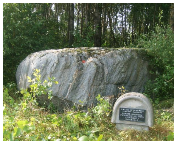
Малюнак 8. Марцін-Камень, в. Лайбуны, Браслаўскі раён