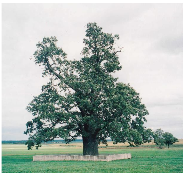
Малюнак 7. Дуб Якуб, в. Казлы, Нясвіжскі раён