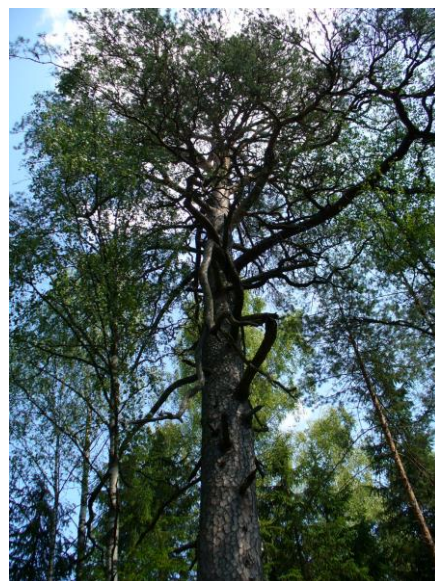
Малюнак 6. Сасна Куліна. Вярхоўе ракі Віліі, Дошчыцкі раён