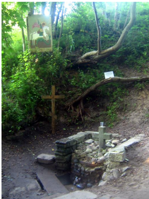
Малюнак 3. Святая крыніца на Юр'евай Гары ў Віцебску