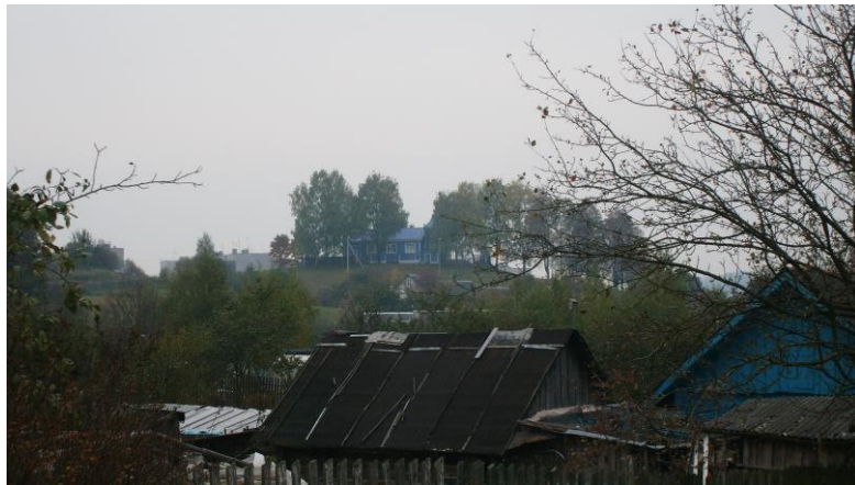
Малюнак 2. Ільінская Гара, г. п. Радашковічы, Маладзечанскі раён