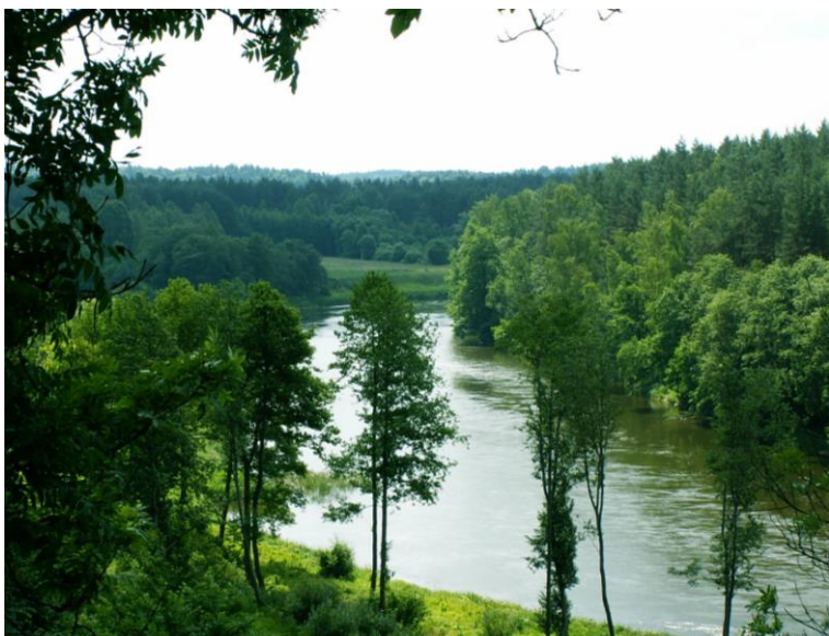
Малюнак 5. Рака Вілія, Астравецкі раён