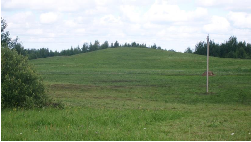
Малюнак 1. Перунова Гара, в. Вялікі Поўсвіж, Лепельскі раён