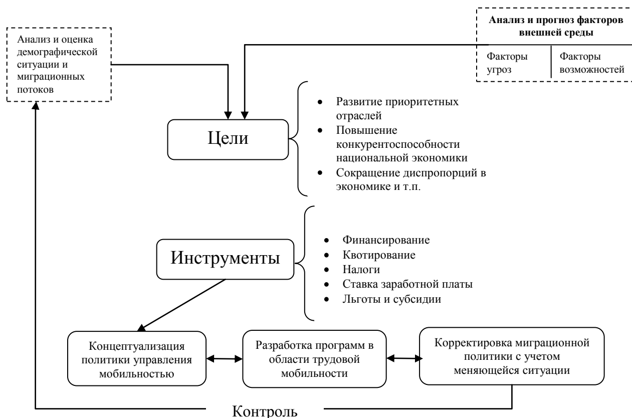
Рисунок 4. – Модель управления трудовой мобильностью в условиях региональной экономической интеграции

Автором предлагается модель управления трудовой мобильностью на национальном рынке труда, на основе которой можно разрабатывать миграционную политику Республики Беларусь (рисунок 4).