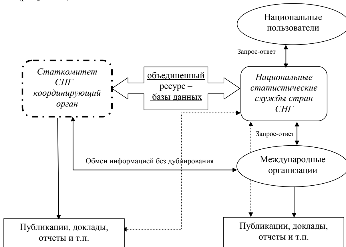
Рисунок 3. – Схема организации сбора и обмена данными в странах СНГ

Выявлена необходимость создания объединенной базы данных в странах Содружества на основе заключенных соглашений. Государствам-участницам Содружества следует обмениваться данными на региональном уровне и координирующим органом может стать Статистический комитет СНГ (рисунок 3).