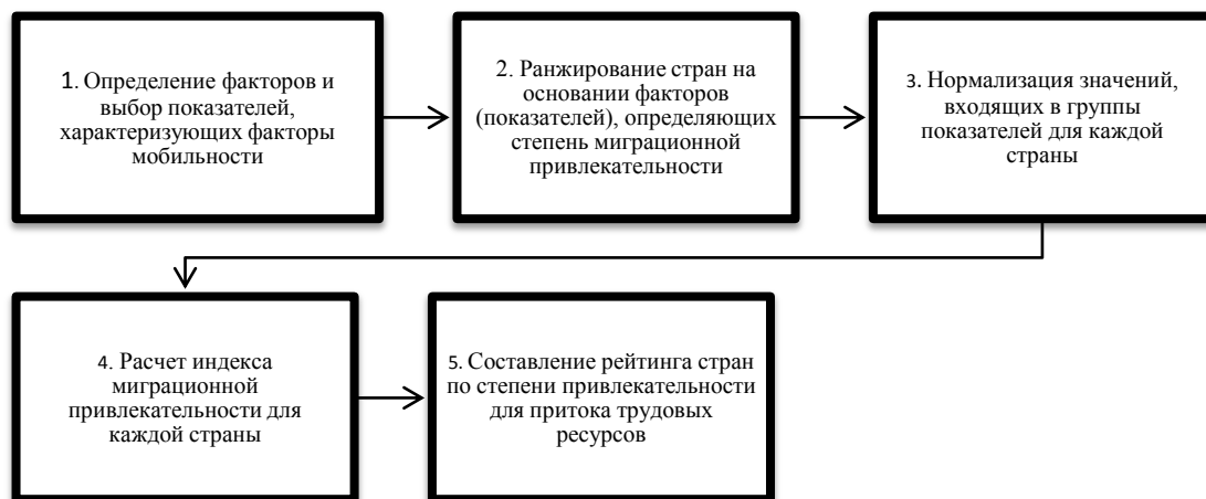
Рисунок 1. – Этапы оценки миграционной привлекательности стран

Предложенную методику оценки миграционной привлекательности стран-участниц регионального объединения можно представить схематично состоящей из ряда этапов, показанных на рисунке 1.