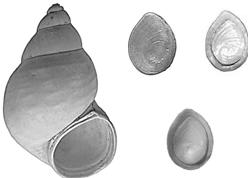
Рис. 2. Parafossorulus crassitesta (Brömme): раковина из отложений разреза Каротояк на р. Верхний Дон и крышечки из отложений разреза Жарново

Fig. 2. Parafossorulus crassitesta (Brömme): shell from deposits of Korotoyak on the Upper Don and operculum from deposits of the Zharnovo site