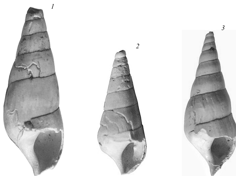
Рис. 3. Fagotia wuesti Meijer: раковина из отложений разреза Жарново (Польша), образец 28, глубина 138,4–138,6 м (1–2) и 138,5–138,6 м (3)

Fig. 2. Parafossorulus crassitesta (Brömme): shell from deposits of Korotoyak on the Upper Don and operculum from deposits of the Zharnovo site