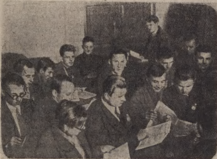
Мануальныя прапагандыстаў у партгабінеце.