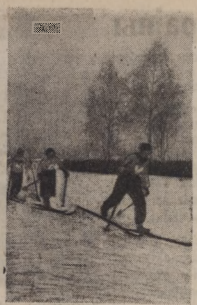
Спаборніцтва на лыжах.

Каварыц робіць уступнае слова. У сваёй кароткай прамова ён ад-