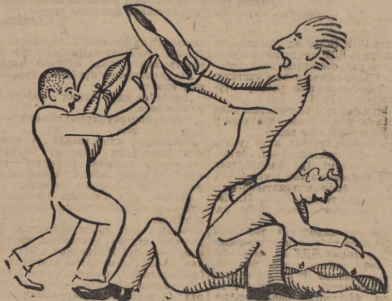
...І часта хлопцы размінаюць мускулы ў падушчым баі