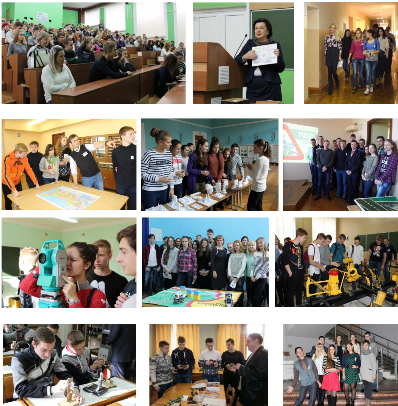
Рис. 3. День проведения познавательного тура

логично встраиваются в основную общеобразовательную программу; организовывать краткосрочные ориентировочные ознакомительные программы по специальностям, чтобы школьники могли из предложенного спектра выбрать с учетом индивидуальных профессиональных запросов и приоритетным для региона направлениям.