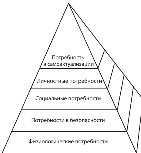
Рисунок — Иерархия потребностей по А. Маслоу

Третий уровень — социальные потребности . К ним относятся потребности в принадлежности к группе, в теплых взаимоотношениях с людьми, во взаимной помощи и поддержке, в любви и дружбе. Если эти потребности актуализированы, но не удовлетворяются, то нарушается регуляция социальной деятельности человека.