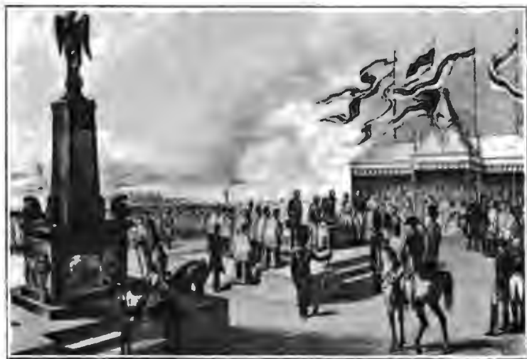
Закладка Кульмскаго памятника русскимъ воинамъ.

Еще большимъ субъективизмомъ проникнута современная Дройзену книга Wachsmuth'a: Das Zeitalter der Revolution Geschichte der Fürsten und Völker Europas (1846—48). Книга посвящена времени отъ конца XVIII вѣка до второго возстановленія на престолѣ Людовика XVIII послѣ 100 дней. Авторъ—горячій радикаль и противникъ того консервативнаго духа, этического спокойствія, которымъ была проникнута историческая школа. «Безсмысленно писать для потомства, не думая о современности», говоритъ онъ и требуетъ, чтобы книги оцѣнивались «по масштабу вѣры въ добро» ихъ авторовъ; добро же стоитъ на сторонѣ «прогресса и революціи», разрушившей старыя «идеалы спокойствія и реакціи и провозгласившей принципы свободы изслѣдованія и терпимости».