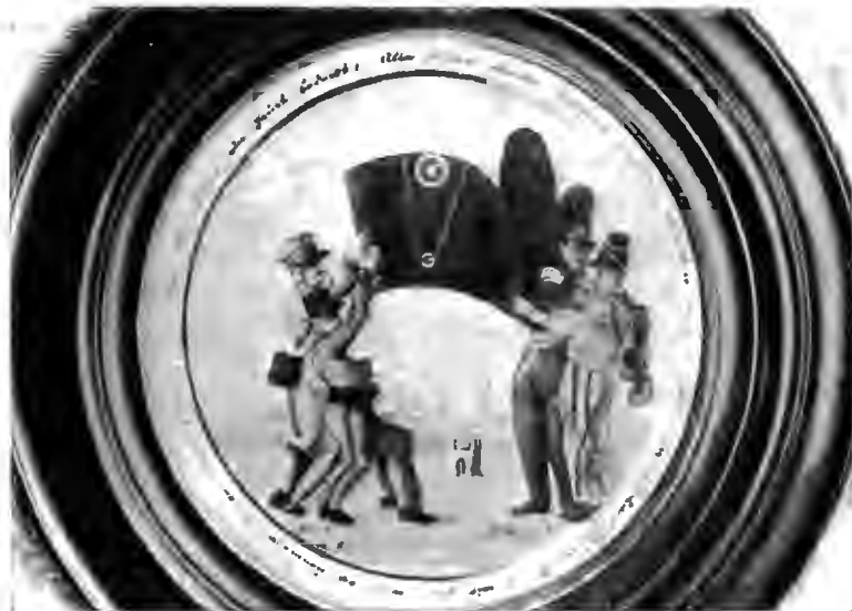
Шапка Наполеона. (Совр. карик.)

Изъ нѣмецкой литературы, специально посвященной Наполеону, слѣдуетъ выдѣлить два труда, относящихся къ сравнительно недавнему времени. Во-первыхъ, книга Auguste Fournier: Napoleon I, eine Biographie (1886—89, 3 тома). Книга Fournier'a цѣннатѣмъ, что авторъ стоитъ въ курсѣ всего того, что было сдѣлано относительно Наполеона въ исторической литературѣ до его времени. Онъ даетъ подробный указатель всѣхъ печатныхъ источниковъ, относящихся къ Наполеону, но признаетъ въ то же время, что на основаніи имѣющагося пока матеріала еще невозможно