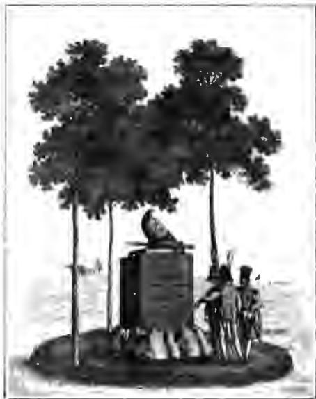
Памятникъ ген. Моро близъ Дрездена. (4 ноября 1814 г.).

Перейдемъ теперь къ болѣе частнымъ нѣмецкимъ трудамъ, прямо посвященнымъ войнѣ 1812 года. Здѣсь надо отмѣтить прежде всего книгу графа Toll'я: Denkwürdigkeiten, изд. Бернгарди, 1856, 4 тома. Издатель Бернгарди прибавилъ къ запискамъ Толя въ своемъ изданіи еще и записки нѣкоторыхъ изъ участниковъ войны и даже воспользовался отчасти устными разсказами. Въ этой книгѣ замѣтно враждебное отношеніе автора къ Кутузову, но она интересна обиліемъ подробностей и въ общемъ безпристрастнымъ отношеніемъ автора къ описываемымъ событіямъ. Также интересна обиліемъ сообщаемого матеріала и своимъ спокойнымъ, чуждымъ пристрастія къ кому-либо тономъ и книга генерала Clausewitz'a: Der russische Feldzug von 1812 (въ VII томѣ сочиненій генер. Клаузевица). Несмотря на то, что авторы были современниками описываемыхъ событій, ихъ книги нельзя подвести подъ типъ мемуарной литературы, ибо помимо собственныхъ воспоминаній авторы пользовались и литературнымъ матеріаломъ.