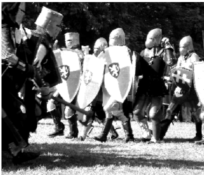
Рис. 1. Лошицкий фэст в начале лета 2007 г.

Одним из самых стильных осенних уголков города Минска является Лошицкий парк, который был заложен во второй половине XIX века на правом высоком берегу р. Свислочь и представляющий ныне место тренировок сборной страны по гребле на байдарках. Осень 2007 года зафиксировала новую тенденцию: он стал таким «священным лесом» (считай «холи-вудом») местного масштаба, благодаря формированию интереса к его необъяснимым явлениям и возрождению интереснейших легенд, популяризация которых связана с ежегодным «Лошицким фэстом».