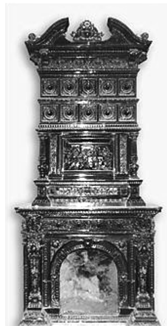
Рис. 2. Камин

Центральное место в покоях занимают цветные изразцовые печи, главенствующее место среди которых занимает камин, выполненный в Риге по немецким образцам. Каждое помещение в усадьбе по своему дизайну отличалось от другого: вестибюль в английском стиле, коридор и лестничный объем – с помпейскими росписями, библиотека и столовая – с элементами ренессанса, а гостиные – в стиле рококо. Самый большой из салонных залов дома со стороны паркового фасада дополняет широкая терраса, с которой открывался великолепный вид на гладь реки и заречные окрестности. Сам парк с кольцевыми прогулочными маршрутами начинается от торцевого фасада дома.