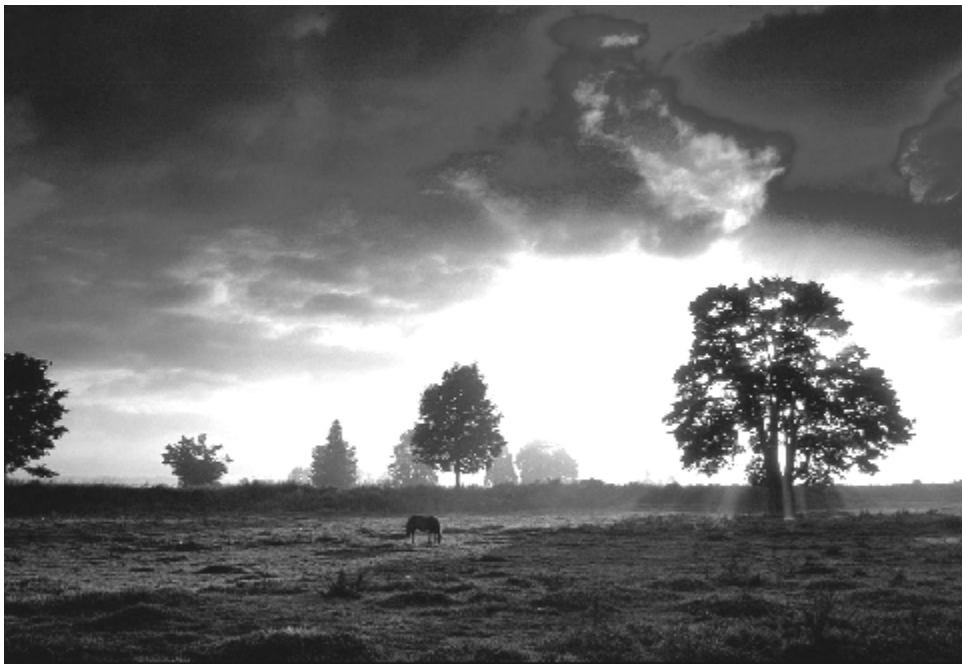
Рис. 4. Пойма Свислочи и Лоши

Вторая часть Лошицкого комплекса представляет собой уникальный природный комплекс, сохранившийся ныне в черте крупного промышленного города. Здесь можно встретить те немногие оставшиеся уголки природы, которые были характерны для поймы реки Свислочь до ее урбанизации. Композиция парка проста, но составлена очень грамотно — это система четырех старых полей, которые как бы перетекают друг в друга, а центром композиции является усадебный дом на надпойменной террасе — прямо или косвенно (визуально) присутствует во многих перспективах. Перед каждым из четырех фасадов — самостоятельные ландшафтные участки.