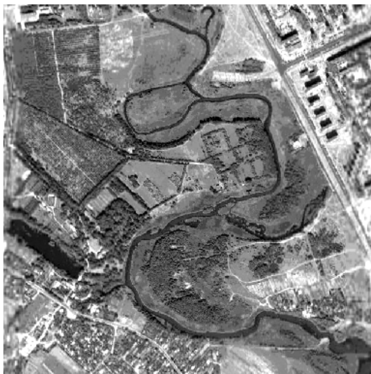
Рис. 3. Часть водно-паркового диаметра Минска – Лошицкий парк

Со стороны ясно видно, что планировка и взаиморасположение строений несет планировочные черты русской усадьбы конца XIX века (парадный партер в форме сердца), с круговой планировкой, округлой границей, центростремительными аллеями и всеми чертами нерегулярного парка. В свою очередь головные строения приобретают черты модной «закопанской» архитектурной тенденции или элементы швейцарского «шале». В начале XX века графский дом реконструируется в