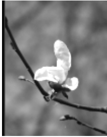
Рис. 5. Магнолия

В породном составе парка ныне выделяются натурализованные интродуцированные уникальные и редкие виды-экзоты возрастом 100-150 лет, обязанные своим появлением владельцам усадьбы и деятельности филиала Всесоюзного института растениеводства, среди которых уникальными являются гингко двухлопастной, магнолия кобус, багряник японский, дуб пушистый, ясень маньчжурский, редкими — орех маньчжурский, сосна горная, крымская, черная и Веймутова, пихта сибирская, лиственница европейская и японская, абрикос маньчжурский. В «Энциклопедии природы Беларуси» (1984) еще упоминаются среди редких экзотов лиственница сибирская, гортензия Бретшнейдера, береза бумажная и Эрмана, орех Зибольда.