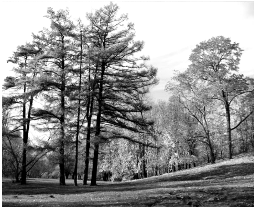
Рис. 6. Пихта сибирская и лиственница японская

В пределах парка отмечаются элементы двух или трёх надпойменных террас реки Свислочь, что редкость на водораздельных территориях. При образовании парка были выровнены террасы, создан искусственный пруд. Территория отличается холмистым, относительно более расчлененным и эрозионно-преобразованным, живописным рельефом с прекрасными видами на пойму со смотровых площадок на террасе. Относительные высоты составляют 3-8 метров. Общий уклон поверхности территории направлен в сторону реки Свислочь. Кроме того, здесь сохранилось