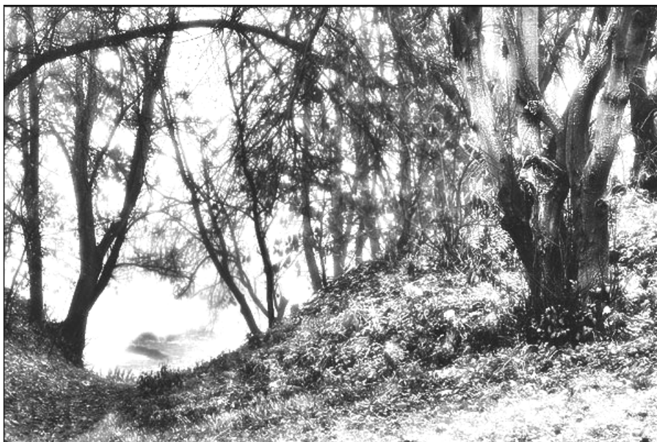
Рис. 8. Пейзажный парк

архитектурного наследия европейских городов. От политики консервации планируется перейти к политике интеграции культурного наследия в инфраструктуру современного города, в жизнь горожан. Это отвечает и потребностям развития туризма. Не случайно в оборот введено новое понятие — урбатуризм. Наконец, трудно переоценить культурологическую значимость такого приоритета.