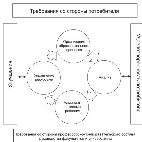
Рис. 5. Схема обеспечения качества организации образовательного процесса по дисциплине «Физическая культура»