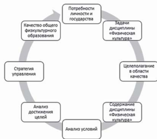
Рис. 1. Этапы формирования качества общего физкультурного образования

Проблема общего физкультурного образования молодежи многопланова. По мнению В. П. Лукьяненко, существуют трудности в терминологическом обеспечении учебной дисциплины «Физическая культура», соответствии ее структуры и содержания современным потребностям личности и общества, четкой детерминации задач и наличии эффективных способов их решения. Обеспечение качества, в свою очередь, невозможно без рационально организованной системы управления. В качестве основания для выработки стратегии развития общего физкультурного образования необходимо использовать данные анализа всех компонентов образовательной системы и соотношения их характеристик с установленными целями (рис. 1).