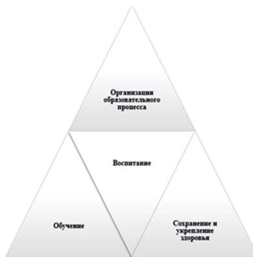
Рис. 2. Система компонентов общего физкультурного образования студентов

качества результатов обучения, а также специфической для физического воспитания составляющей – здоровьесберегающей деятельности (рис. 3).