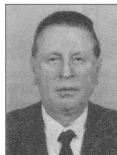
В.С. Казаков, министр здравоохранения Республики Беларусь в 1990–1994 гг.