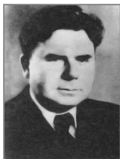
И.А. Инсаров, министр здравоохранения БССР в 1948–1966 гг.