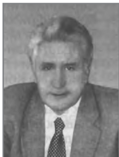
И.Б. Зеленкевич, министр здравоохранения Республики Беларусь в 1997–2001 гг.