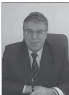
В.П. Руденко, и.о. министра здравоохранения Республики Беларусь в 2006 г.