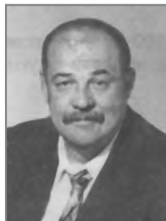
В.А. Остапенко, министр здравоохранения Республики Беларусь в 2001–2002 гг.