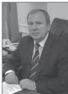
В.И. Жарко, министр здравоохранения Республики Беларусь с 2006 г.

ма. 2002–2009 г.г. – заместитель министра здравоохранения Республики Беларусь. В 1995–2000 гг. избирался депутатом Верховного Совета Республики Беларусь, Палаты Представителей Национального Собрания Республики Беларусь. Имеет благодарность Президента Республики Беларусь [29].