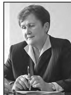
Л.А. Постоялко, министр здравоохранения Республики Беларусь в 2002–2004 гг.

чом-терапевтом, в 1960–1965 гг. — заместителем главного врача Хотимской районной больницы Могилевской области, в 1965–1972 гг. — главным врачом Костиюковичского района Могилевской области. В 1972–1978 гг. занимал пост заместителя заведующего отделом здравоохранения этого облисполкома. В 1987–1990 гг. был заместителем министра здравоохранения БССР [7].