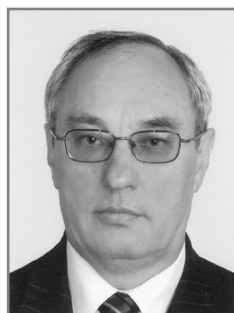
В.С. Улащук, министр здравоохранения БССР в 1987–1990 гг.