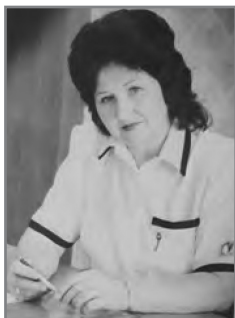
И.М. Дробышевская, министр здравоохранения Республики Беларусь в 1994–1997 гг.