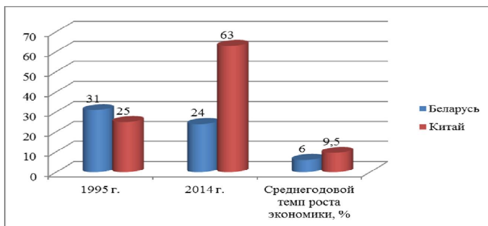
Рис. 1. Показатели динамики доли частного сектора и роста ВВП Китая и Беларуси за 1995-2014 гг., %

Источник: разработка автора на основании [1, 2]