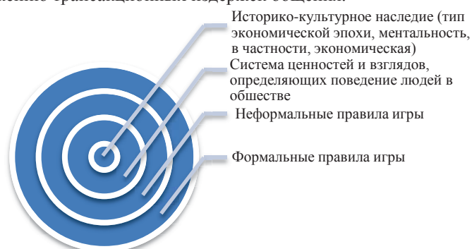
Рис. 1. Структура института

Возникает не только эффект синергии, но и эффект доверия, которые ведут к снижению транзакционных издержек общения.