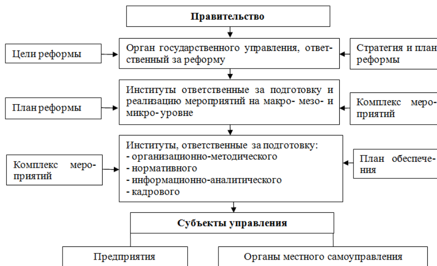
Рис. 3. Укрупненная схема механизма управления реформой.

Составные части организационного механизма управления реформой приведены на схеме (рис. 3).