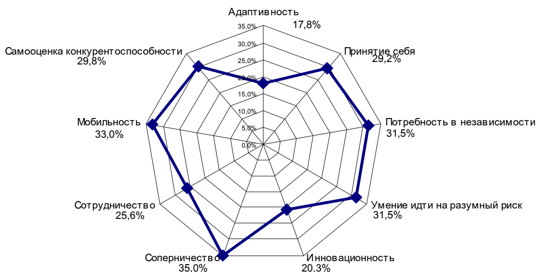
Рисунок 2 – Психологический профиль развития конкурентоспособности безработных-будущих предпринимателей

развития всех психологических характеристик не превышает даже 50%, что свидетельствует о «слабости» и значительном незадействованном потенциале структуры развития конкурентоспособности безработных-будущих предпринимателей. Следует отметить, что такие характеристики психологического профиля обуславливают необходимость комплексного использования экономической (выплата помощи по безработице для открытия своего дела) и психологической (исследование и развитие психологических характеристик конкурентоспособности) компонент в системе подготовки безработных к будущей успешной предпринимательской деятельности в условиях конкуренции, а также необходимость разработки и внедрения специальных форм психологической помощи будущим предпринимателям в развитии способности к успешному конкурентному взаимодействию.