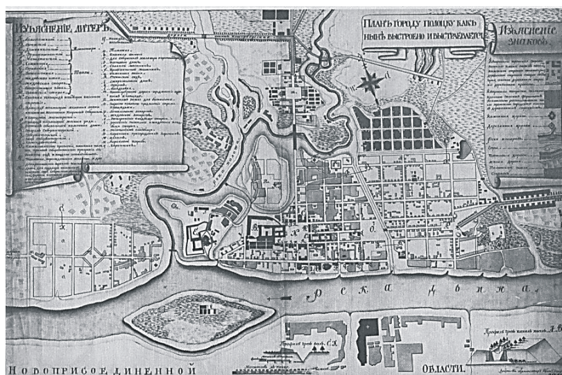
Рисунок 2. Проект перепланировки Полоцка 1793 г. (Архитектор И.Зигфриден)