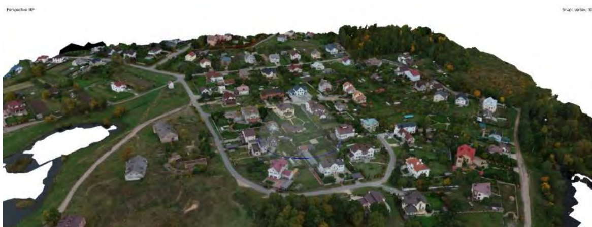
Рис. 2. Тайловая 3D-модель на территорию аг. Прилуки

После выравнивания снимков создается плотное облако точек [1]. На основе плотного облака точек производится построение тайловой модели (рис. 2).