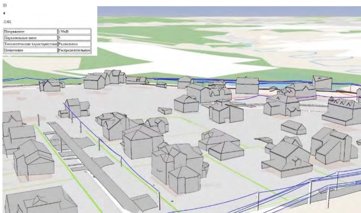
Рис. 4. Оцифрованная южная часть населенного пункта в ПО ГеоСкан Спутник с атрибутивной информацией

Таким образом на рисунке 4 отображены оцифрованные жилые строения и иные объекты недвижимости с добавленной индивидуальной атрибутивной информацией, включающей параметры строений, материалы, применяемые при строительстве, указанием инвентарных номеров, информации о земельных участках.