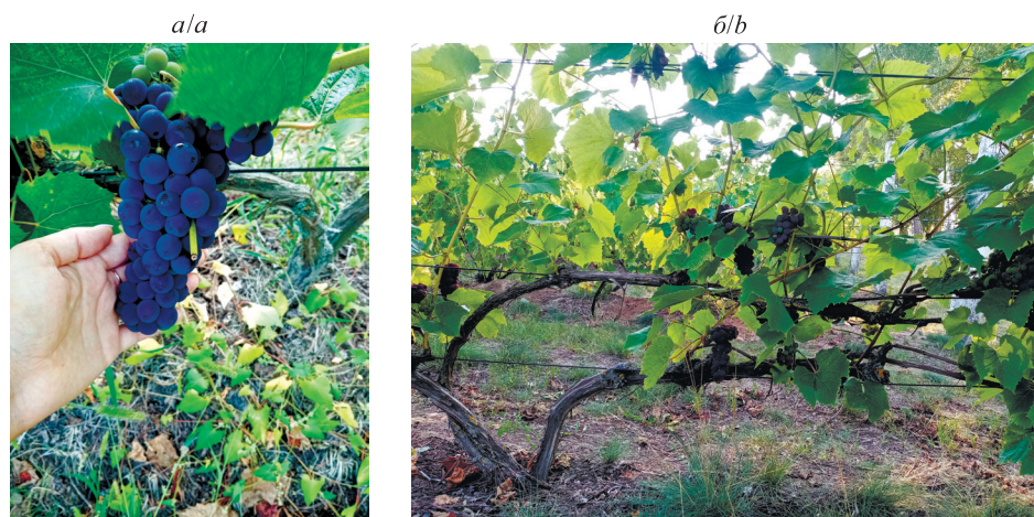
Рис. 1. Виноград сорта Альфа: а – гроздь; б – общий вид куста Fig. 1. Alpha grapes: a – bunch of the grapes; b – general view of the bush

Характеристика сорта Альфа. Срок созревания 110–145 дней. Морозоустойчивость до -35^{\circ}\text{C} . Урожайность 150–180 ц/га. Сахаристость 15–18 %. Кислотность 10–13 г/л. Кусты сформированы в виде четырехрукавного горизонтального кордона. Система ведения шпалерная, вертикальная. Расстояние между кустами 1,2 м, ширина междурядья 2,5 м. Покровные культуры состоят из смеси многолетних трав. Виноградник неорошаемый, неукрывной (рис. 1).