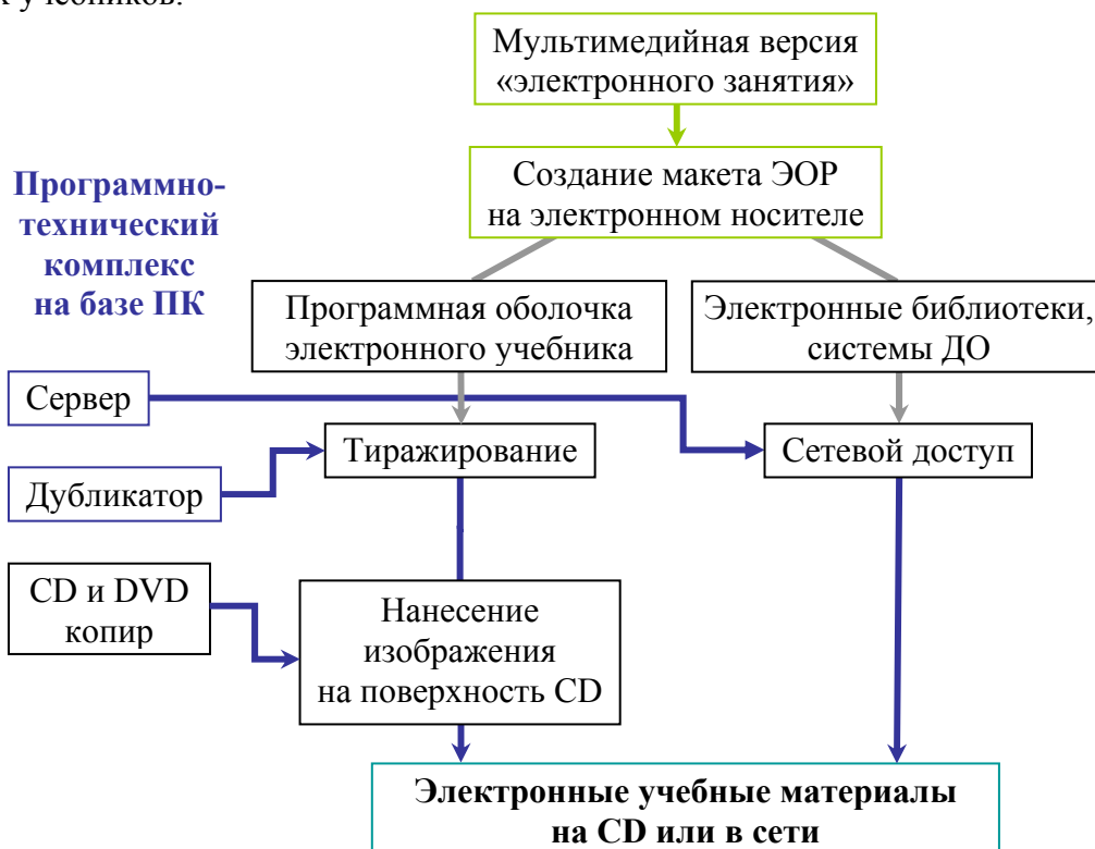
Рис. 3. Третий этап подготовки учебных электронных материалов. Опубликование

Скорректированный и обновленный вариант «электронных занятий», проведенных в течение семестра собирается в единый комплект, записывается на CD и, в последующем, тиражируется (рис. 3). Полученные CD могут распространяться среди студентов дневной, вечерней и заочной форм обучения и могут быть ими использованы для самостоятельной работы, подготовки к промежуточному и итоговому тестированию. Кроме того, «электронные занятия» по отдельности или в комплексе могут быть использованы для поддержки учебного процесса с использованием технологий дистанционного обучения, могут быть помещены в электронную библиотеку, решая, таким образом, вопрос ее наполнения, и могут быть использованы авторами для подготовки оригинальных электронных учебников.